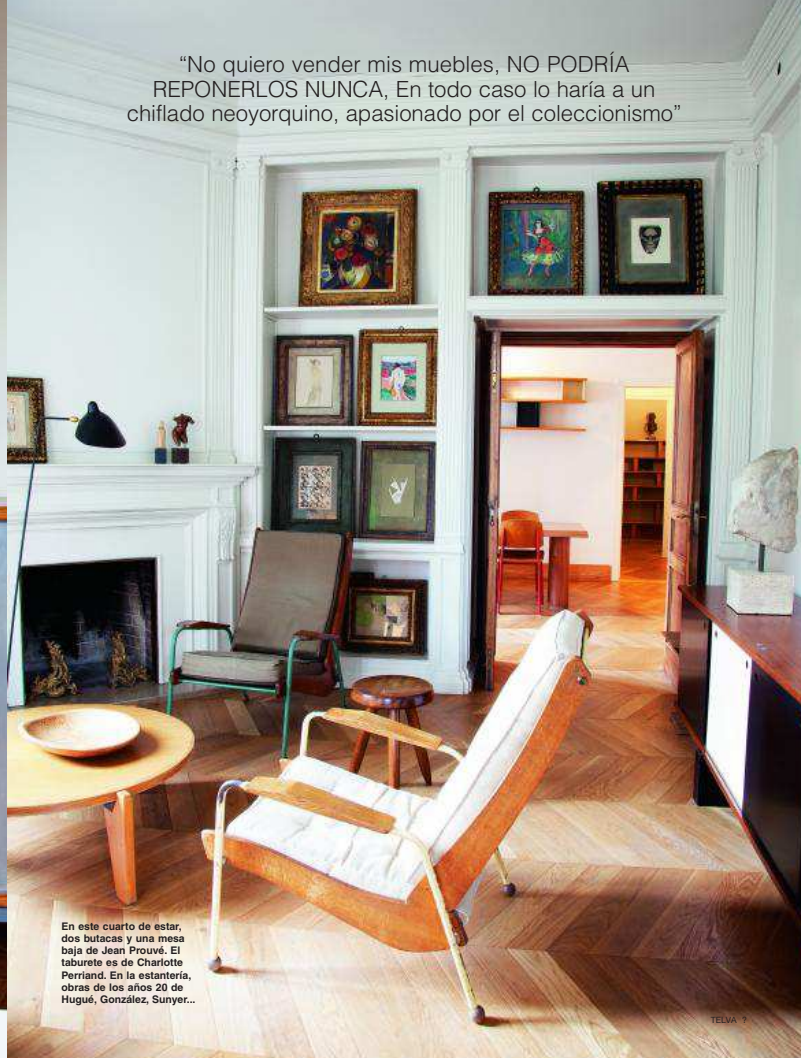
En este cuarto de estar, dos butacas y una mesa baja de Jean Prouvé. El taburete es de Charlotte Perriand. En la estantería, obras de los años 20 de Hugué, González, Sunyer...

“No quiero vender mis muebles, NO PODRÍA REPONERLOS NUNCA. En todo caso lo haría a un chiflado neoyorquino, apasionado por el coleccionismo”