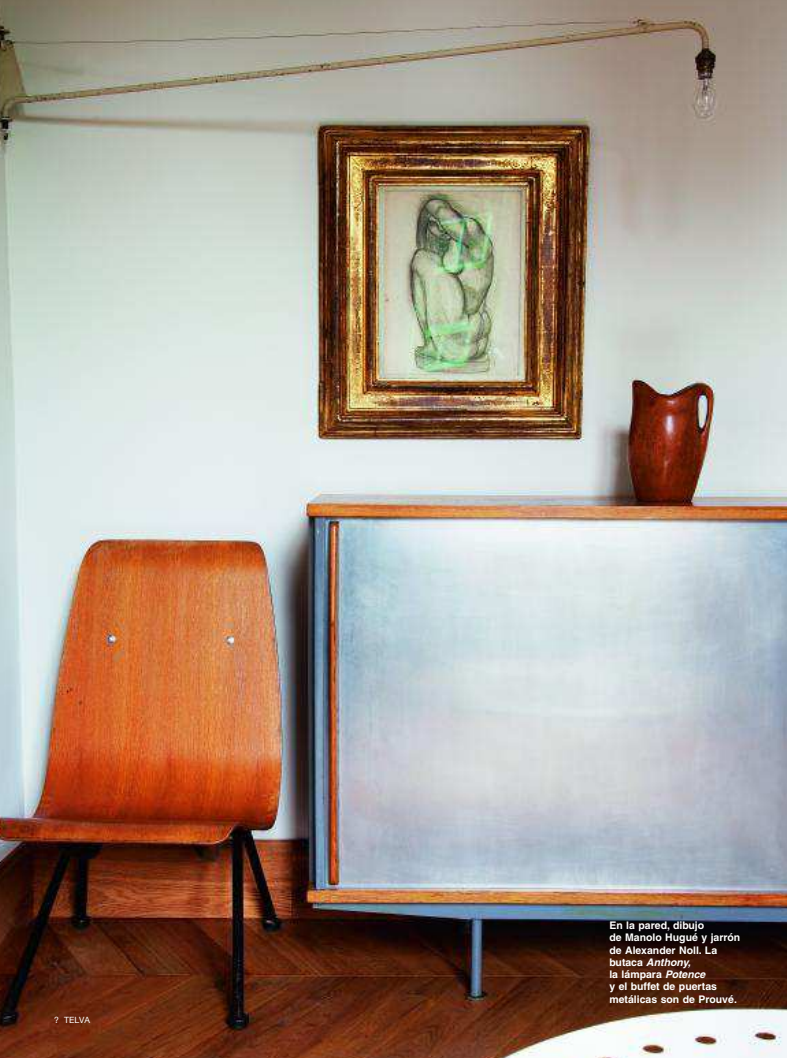
En la pared, dibujo de Manolo Hugué y jarrón de Alexander Noll. La butaca Anthony, la lámpara Potence y el buffet de puertas metálicas son de Prouvé.

“No quiero vender mis muebles, NO PODRÍA REPONERLOS NUNCA. En todo caso lo haría a un chiflado neoyorquino, apasionado por el coleccionismo”