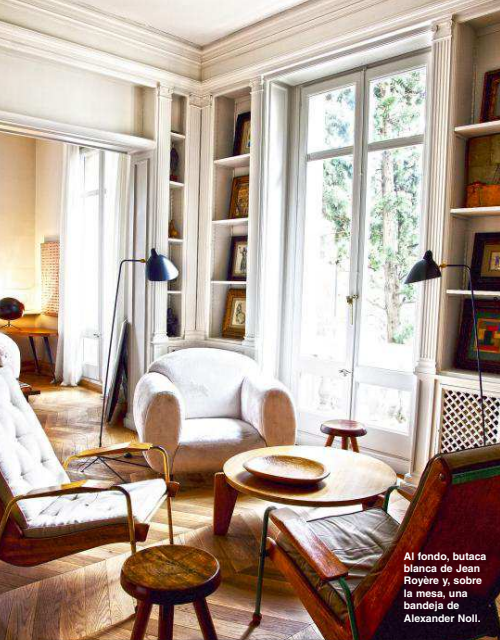
Al fondo, butaca blanca de Jean Royere y, sobre la mesa, una bandeja de Alexander Noll.