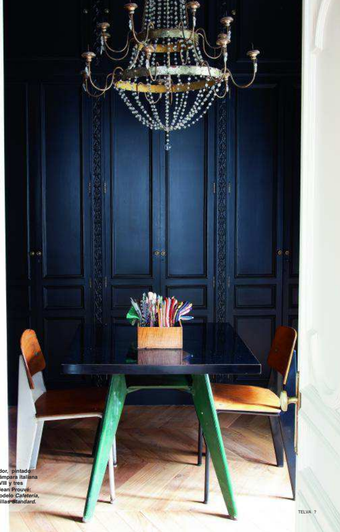
En el vestidor, pintado de negro, lámpara italiana del siglo XVIII y tres piezas de Jean Prouvé: la mesa, modelo Cafeteria , y las dos sillas Standard .

Vamos a ver, quiero un argumento válido para entender que una silla de Prouvé es algo más que un asiento, o para encajar que la mesa Goodyear de Isamu Noguchi (1939) pueda alcanzar en la casa de subastas Philips el exorbitante precio de 4.450.500 dólares. "Hubo arquitectos como Le Corbusier o Mies van der Rohe que entendieron el mobiliario, no como una cosa instrumental, sino como una forma de arte. Cuando